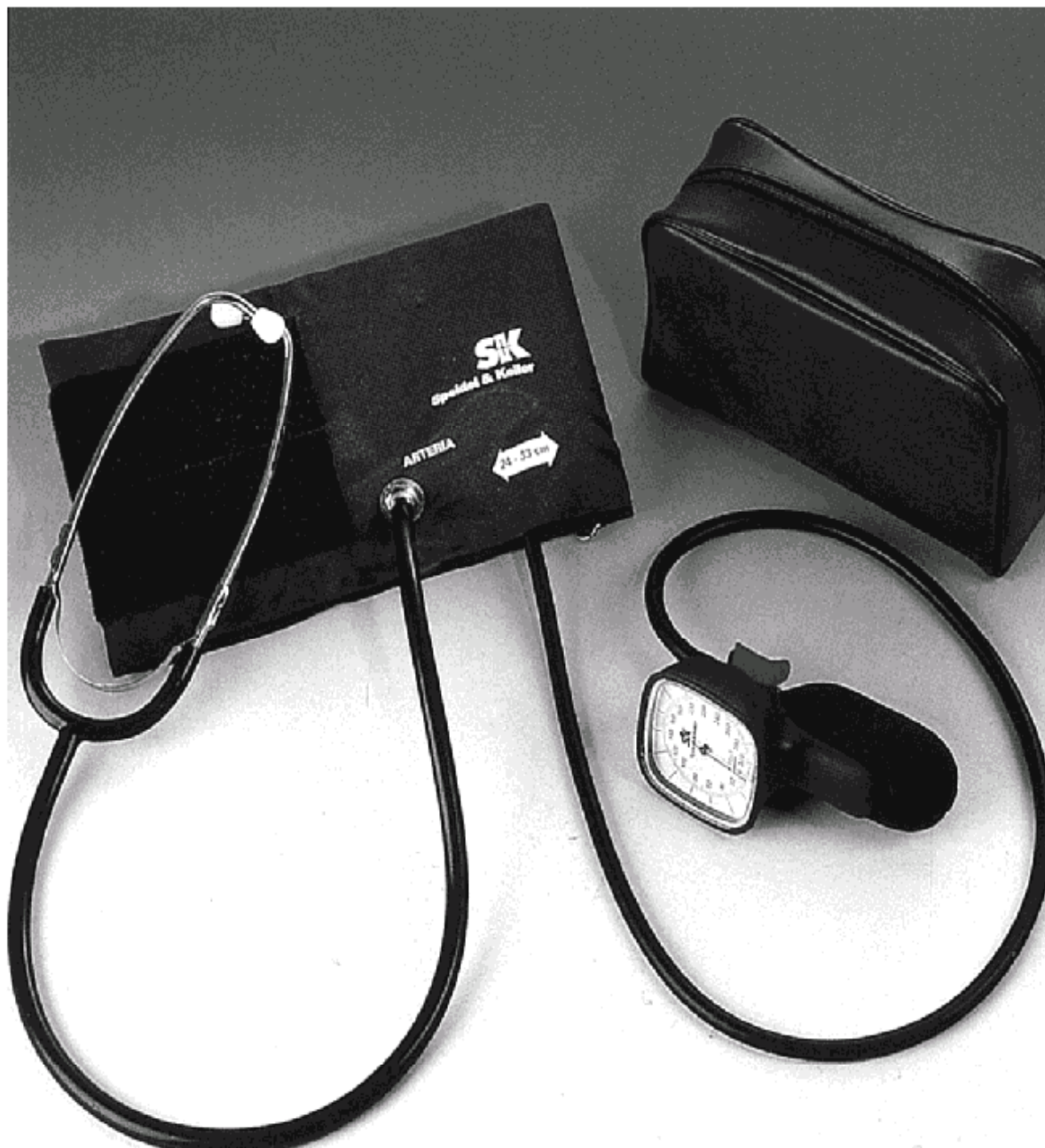
Slika 3: Fotografija tlakomjera tip PERSONA TEST